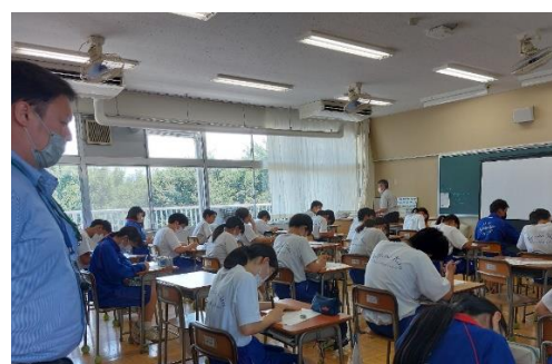
講師の説明終了後、生徒による振り返り、まとめを実施