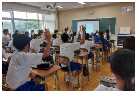
防災に関する選択問題に挙手をする生徒の皆さま