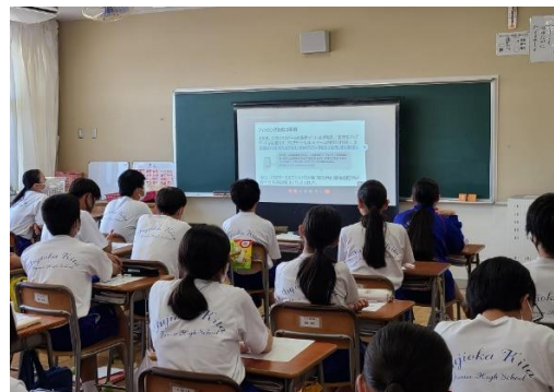
授業模様(各クラスで受講)