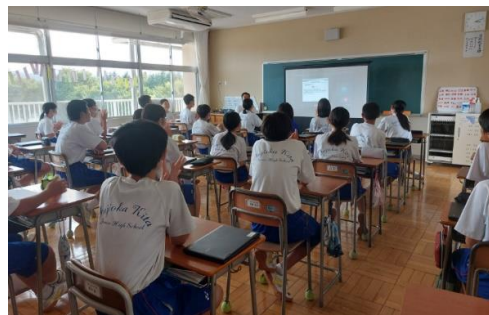
授業模様(各クラスで受講)